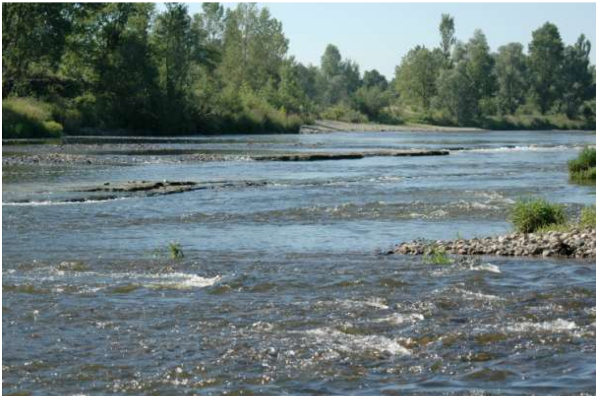
Figure 3 : Le fleuve Loire dans la Plaine du Forez : bancs de marnes émergés, témoins de l'incision du lit

4. Identification des usages et des pressions anthropiques. Sur la base d'un corpus documentaire et d'enquêtes visant à prendre en compte les parties intéressées [17] un état des lieux et des scénarios d'évolution de la demande et des besoins en eau par rapport à la ressource disponible seront établis. Sur la base de ces informations, des simulations seront réalisées à l'aide du modèle de nappe.