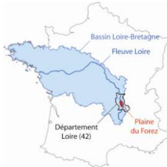
Figure 1: Localisation de la Plaine du Forez (Données : IGN BD Carthage ; ARCGIS 9.2., Adobe illustrator)

Les enjeux liés à 2 outils de gestion de l'eau ont ainsi été pris en compte :