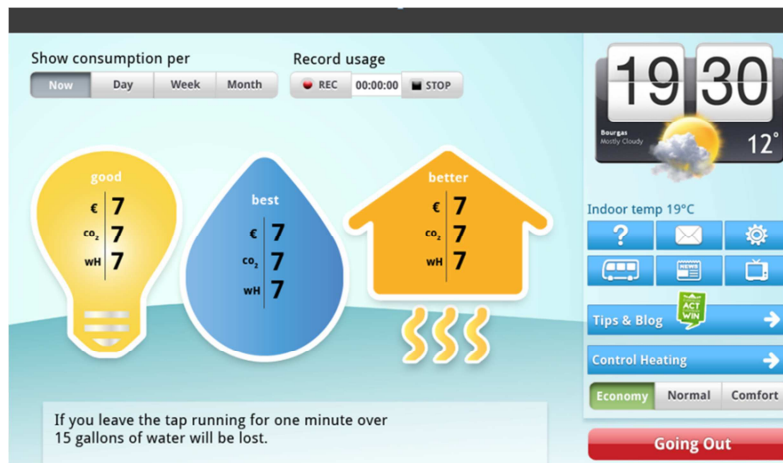
Figure 2 : Interface utilisateur proposée dans le cadre du projet SHWE-IT