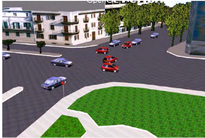
FIGURE 3. Carrefour Roma-Zerbi : un exemple d'intersection simulé par une approche multi-agent (simulateur ArchiSim)