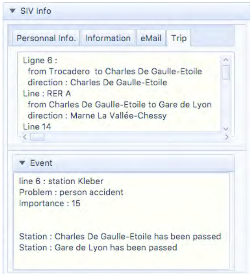
FIGURE 2. Une Interface SIV alertant d'un événement imprévu dans le déplacement d'un usager