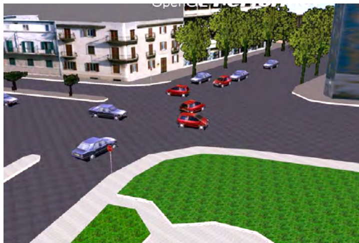
FIGURE 3. Carrefour Roma-Zerbi : un exemple d'intersection simulé par une approche multi-agent (simulateur ArchiSim)