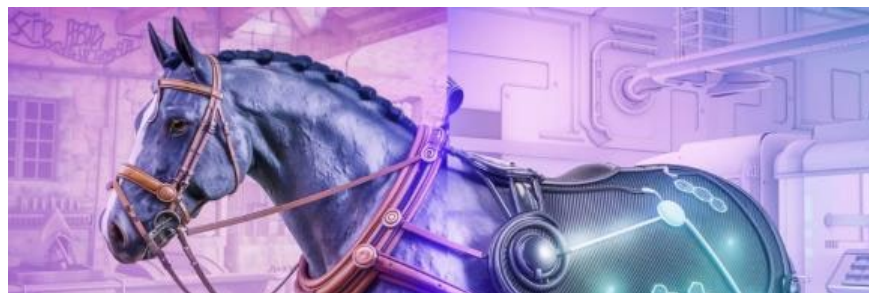
© Alice Monier Torrente & Ideogram

Notre société a tendance à positiver l'innovation et il semble, pour toute entreprise, tout à fait légitime de se dire « innovante ». Pour autant, certains secteurs ne semblent pas toujours accueillir l'innovation favorablement : c'est le cas des secteurs ou métiers traditionnels. En considérant la filière équine comme une industrie traditionnelle, nous nous posons la question du lien à l'innovation dans les discours des entreprises industrielles et de services. Nous proposons de montrer ce qui est légitime pour les entreprises de la filière équine française (les logiques institutionnelles), et dans quelle mesure l'innovation fait partie de ces éléments . Nos résultats montrent l'existence de quatre logiques institutionnelles, fonction des types d'entreprises, et une logique commune à toutes les entreprises, avec une faible mention de l'innovation. Pour nous, les éléments de légitimité lisibles dans la filière équine induisent une approche de l'innovation soumise à une contrainte forte : le recours à l'innovation constituant une certaine contradiction avec les logiques institutionnelles du champ.